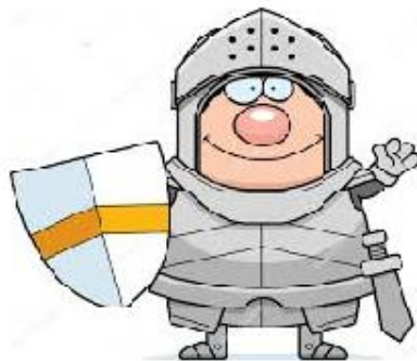
NA 3 DAGEN KAMP